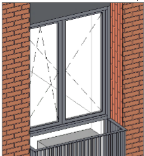
Рисунок 3.4.3 – Линии открывания у окон

Запрещено выполнять отзеркаливание окон, вследствие чего могут возникнуть ошибки связанные с направлением открывания.