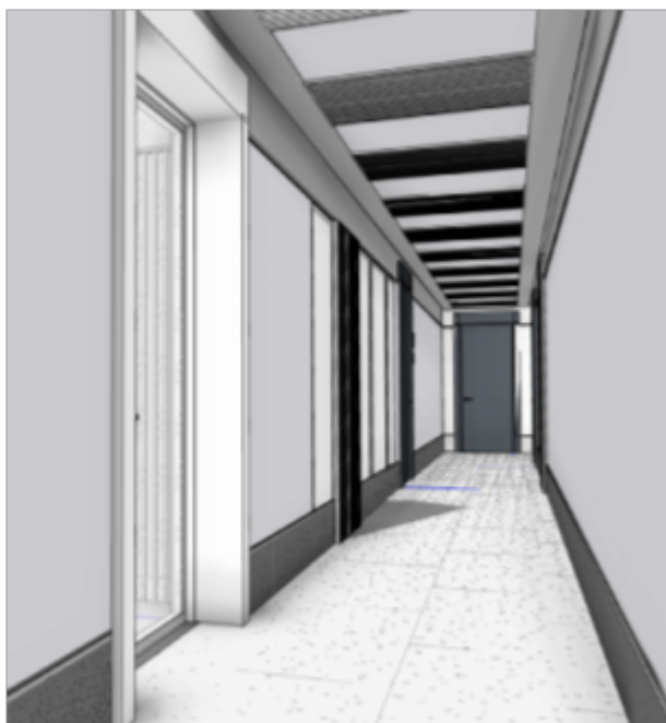
Рисунок 3.12.1 – Модель дизайн-проекта МОП

Модель интерьеров (дизайн-проекта) выполнять в Autodesk Revit в отдельном файле (Рисунок 3.12.2). В качестве исходных данных для планировки использовать модели АР и КР, которые необходимо загрузить связанными файлами.